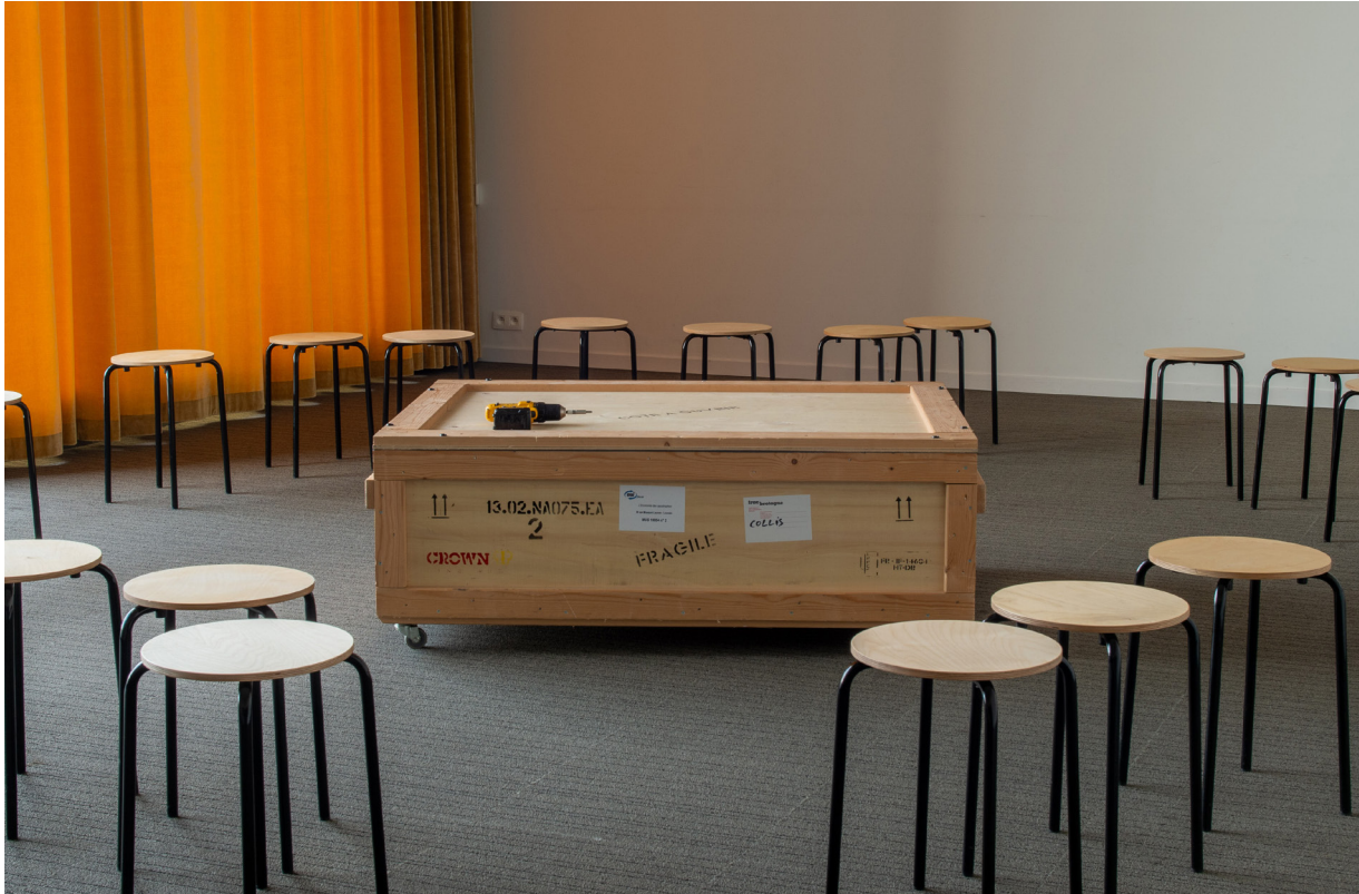
Untitled Ceremony #10 (2017), M Museum, Leuven, 2019.